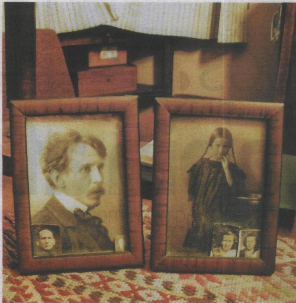
ANT SOFIJOS ČIURLIONIENĖS-KYMANTAITĖS darbo stalo iki šiol stovi įremitos nuotraukos, į kurias ji mėgdavo žiūrėti