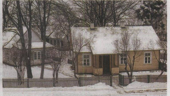
Muziejus kompleksas Druskininkuose prašyte prašosi remonto, bet lankytojų jame netrūksta.

Tačiau šio muziejaus filialui - M.K.Čiurlionio memorialiniam muziejui Druskininkuose - lėšų neskirta, nors apgailėtinos būklės medinių pastatų rekonstrukcijai prašyta tik 300 tūkst. litų. Tokios pinigų sumos būtų užtekę prakiurusiems medinėms lentutėms dengtiems stogams sutvarkyti, langams ir seniems ekspozicijų standams pakeisti, kad jie atitiktų šiuolaikinius standartus, bei prieš dešimtmetį dažytiems pastatams atnaujinti.